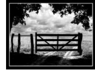
Sítio do Angelim

.B7. .E. Eu não sou muito esperto mas também não sou otário .B7. Minhas contas eu não pago junto pra fazer rosário .A. .E. .A. Relógio trabalha tanto e nunca recebeu salário .B7. .E. .B7. .E. João-de-Barro fez a casa hoje ele é proprietário .B7. .E. Papagaio fala muito e não conhece o dicionário .B7. .E. Garrincha tem perna torta mas foi o mais aplaudido .B7. Meu carro tem pé redondo e faz o rastro comprido .A. .F# .A. Serrote também tem dente e não come nada cozido .B7. .F# .B7. .E. O martelo tem orelha e não sofre dor de ouvido .B7. .E. .B7. .E. As meninas dos meus olhos não precisa usar vestido