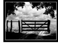
Sítio do Angelim

.F#. .B. .B7. .E. E deixar que a paixão me domine .F#. .B. Num abraço pretender .B7. .E. Ser mais forte do que as leis .F#. .B. Que me prendem a você