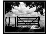
Sítio do Angelim

.E. .F#m. Emagrecendo o coitado .B7. .E. Foi indo até se acabar .A. .B7. Chorando tanto a saudade .B. .E. .B7. De quem não quis mais voltar .E. .F#m. E todo mundo chorava .B7. .E. A morte do cantadô .A. Não tem batuque .B7. Nem samba .B. .E. Sertão inteiro chorou .A. .B7. E todo mundo chorava .B. .E. A morte do cantadô